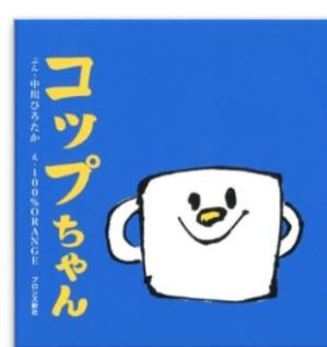
コップちゃん 作：中川 ひろたか 絵：100%ORANGE 出版社：ブロンズ新社