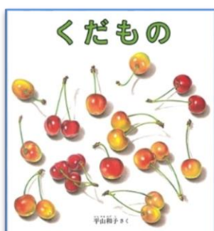
くだもの 作：平山 和子 出版社：福音館書店