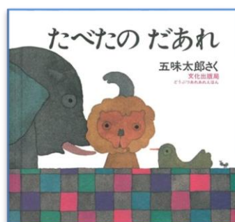
たべたの だあれ 作・絵：五味太郎 出版社：文化出版局